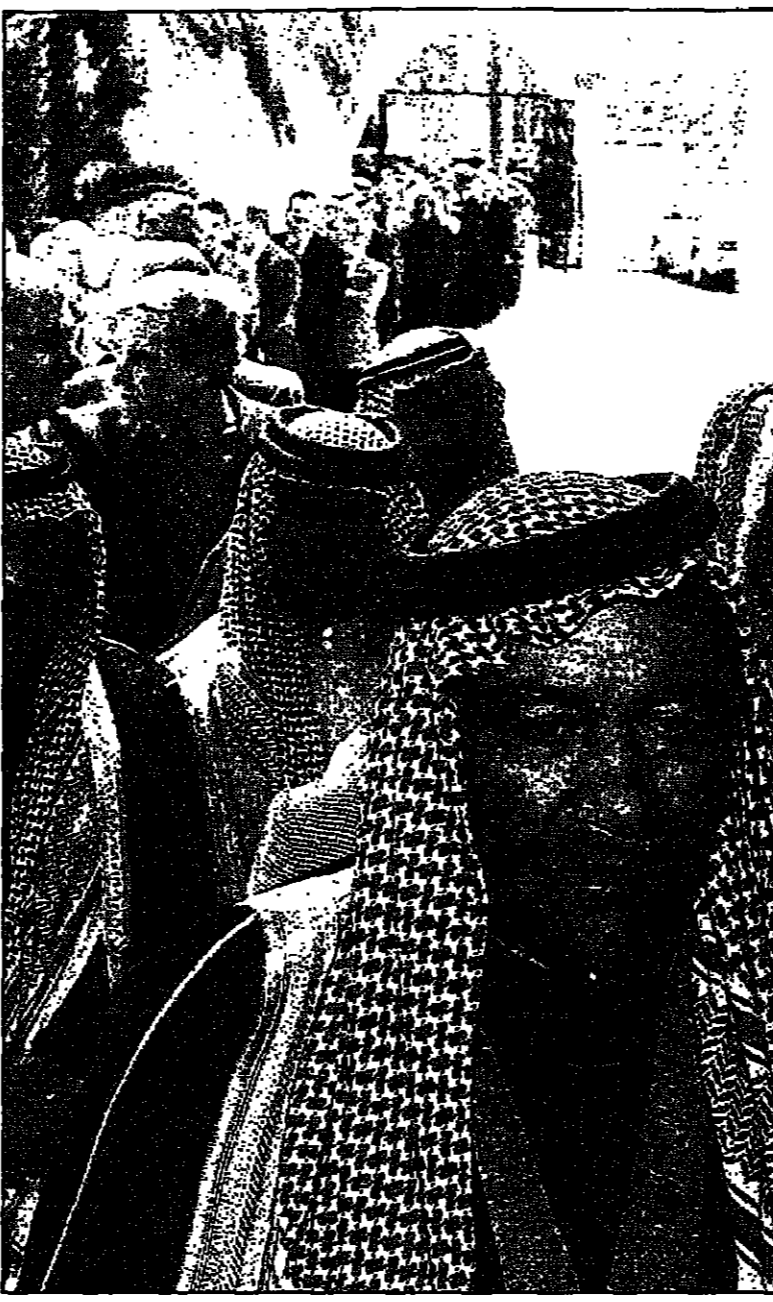
زعماء القبائل الأردنية يصفون لثمن أعضاء الحكومة الجديدة في عمان

وفي دراسة تحليلية عن الحياة الوزارية في الأردن منذ عام 1989 ولغاية الآن وهي فترة عودة الحياة الديمقراطية للأردن فقد تم تشكيل سبع حكومات أردنية كانت حكومة الشريف زيد بن شاكر التي اجرت أول انتخابات برلمانية بعد عودة الحياة الديمقراطية للأردن، من حكومة ضروريان التي شهدت وفاة البرلمان صاحبها عبد الوكيل، وكلاماً جارحاً وجهه معظمه للشخص الوكيل.